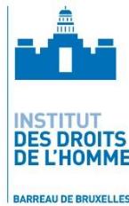
Institut des Droits de l'Homme du Barreau de Bruxelles Bélgica