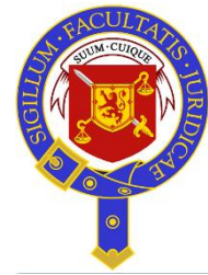
The Faculty of Advocates Escocia