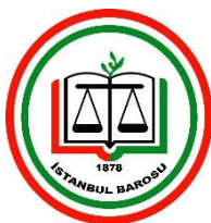
Istanbul Bar Association Turquía