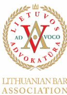
Lithuanian Bar Association Lituania