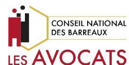
Conseil national des Barreaux Francia