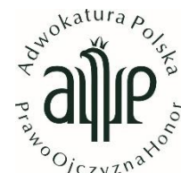
The Polish Bar Council Polonia