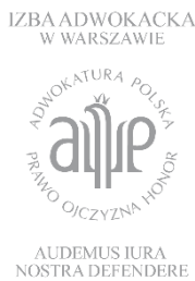
Warsaw Bar Association of Advocates Polonia